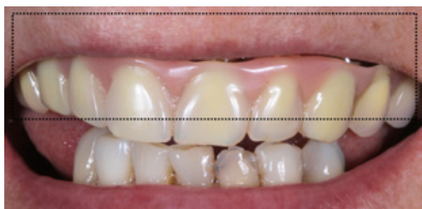
Figura 03 - Avaliação da zona de transição comprometida.