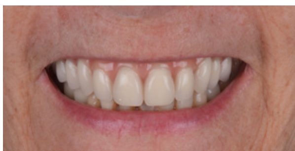
Figura 09 - Instalação da prótese do tipo protocolo provisória.