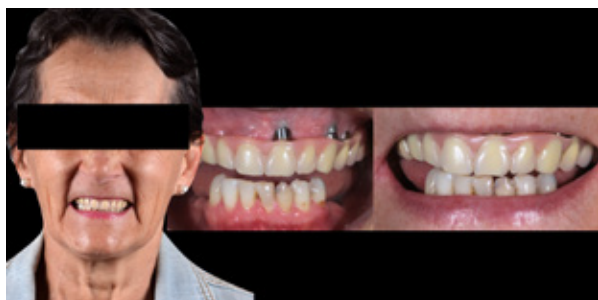
Figura 01 - Aspecto e planejamento inicial através da avaliação sistêmica do paciente e análise extra e intraoral.