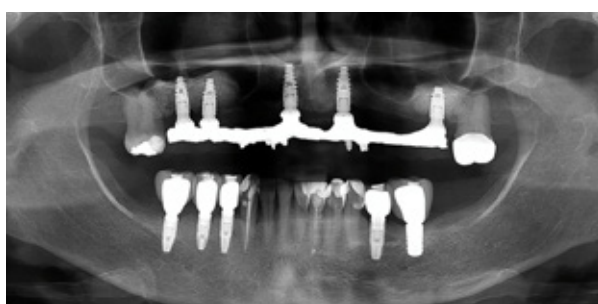
Figura 11 - Regularização do rebordo ósseo e instalação dos novos implantes.