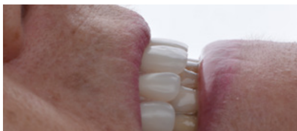
Figura 15 - Suporte labial.