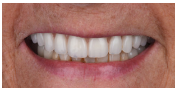
Figura 13 - Sorriso final.