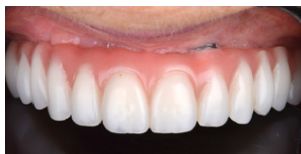
Figura 12 - Confecção da prótese do tipo protocolo.