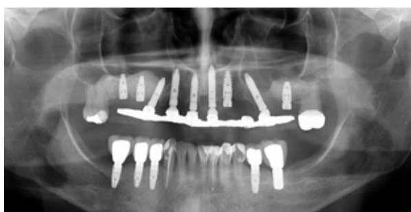
Figura 05 - Após 6 meses, instalação de implantes na área enxertada.