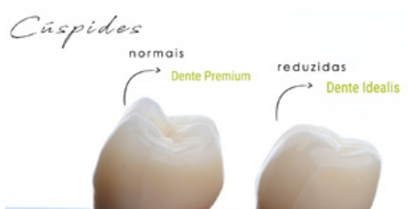
Figura 07 - Escolha dos dentes posteriores.