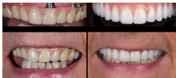
Figura 16 - Aspecto Inicial e Final.