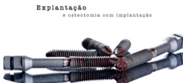
Figura 10 - Fase cirúrgica 2 - Remoção dos implantes, mal posicionados.