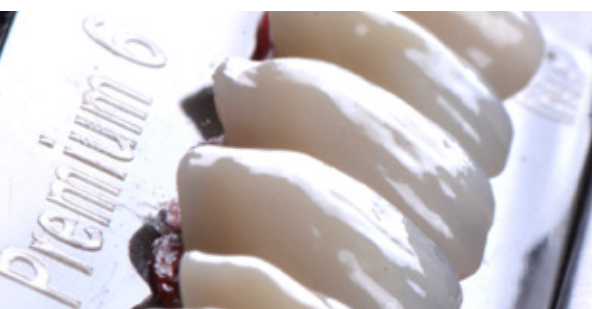
Figura 06 - Escolha dos dentes através da análise facial e aspectos intrabucais.