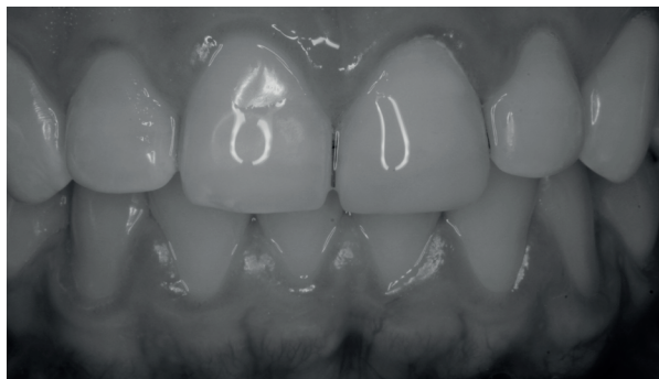
Figura 07 - Imagem final em preto e branco.