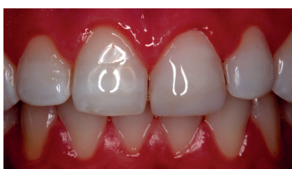
Figura 06 - Imagem final com alto contraste.