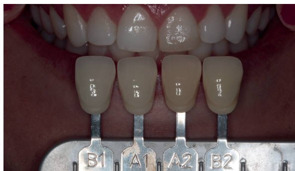
Figura 04 - Seleção de cor.