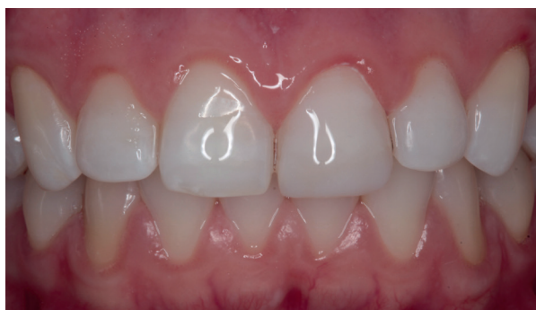
Figura 05 - Imagem após a realização da restauração com Charisma® Diamond.