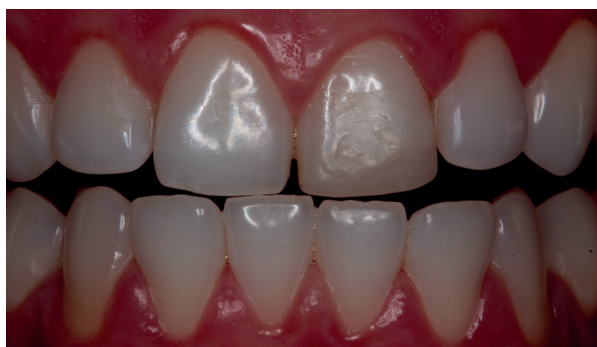
Figura 01 - Aspecto inicial dente 21.